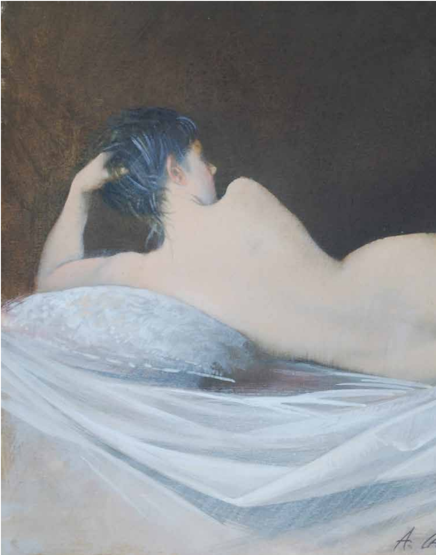
Nudo , olio su tavola cm 30x41,5, 2015