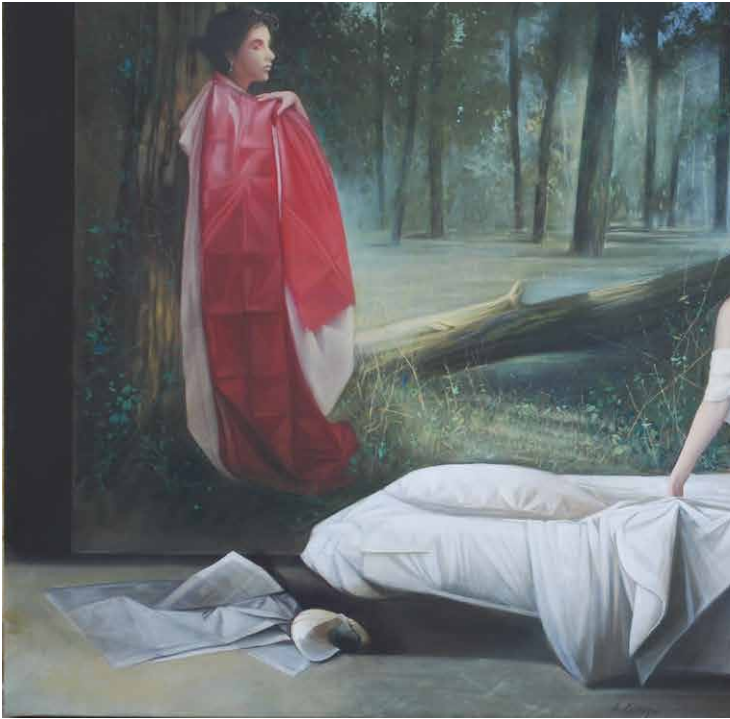
Taci. Su le soglie del bosco... , olio su tavola cm 100x200, 2015