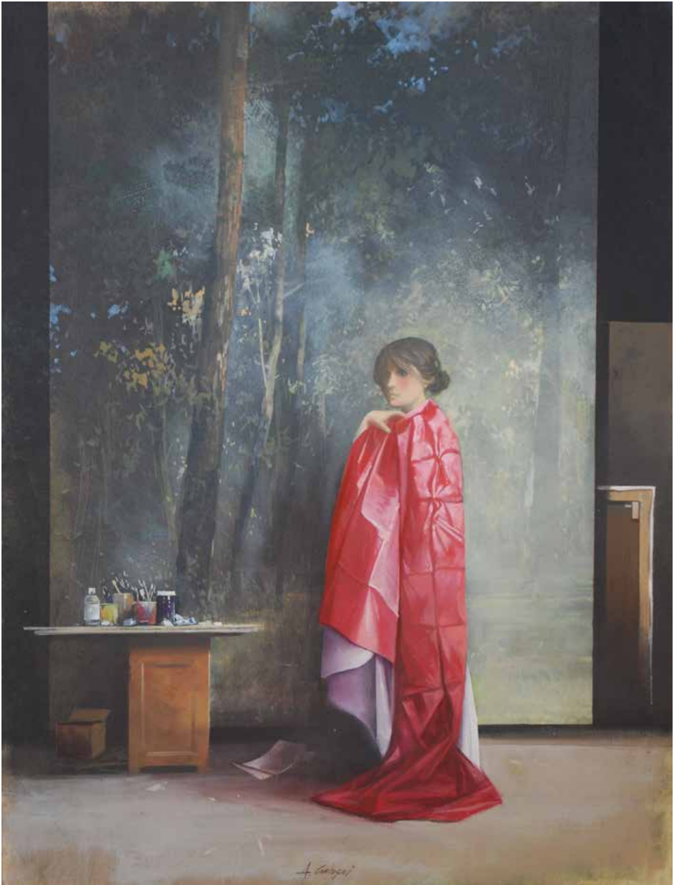
In studio , olio su tavola cm 80x60, 2015