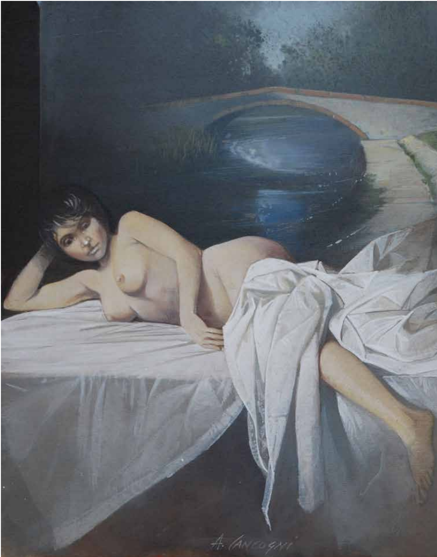
Interno , olio su tavola cm 40x40, 2015