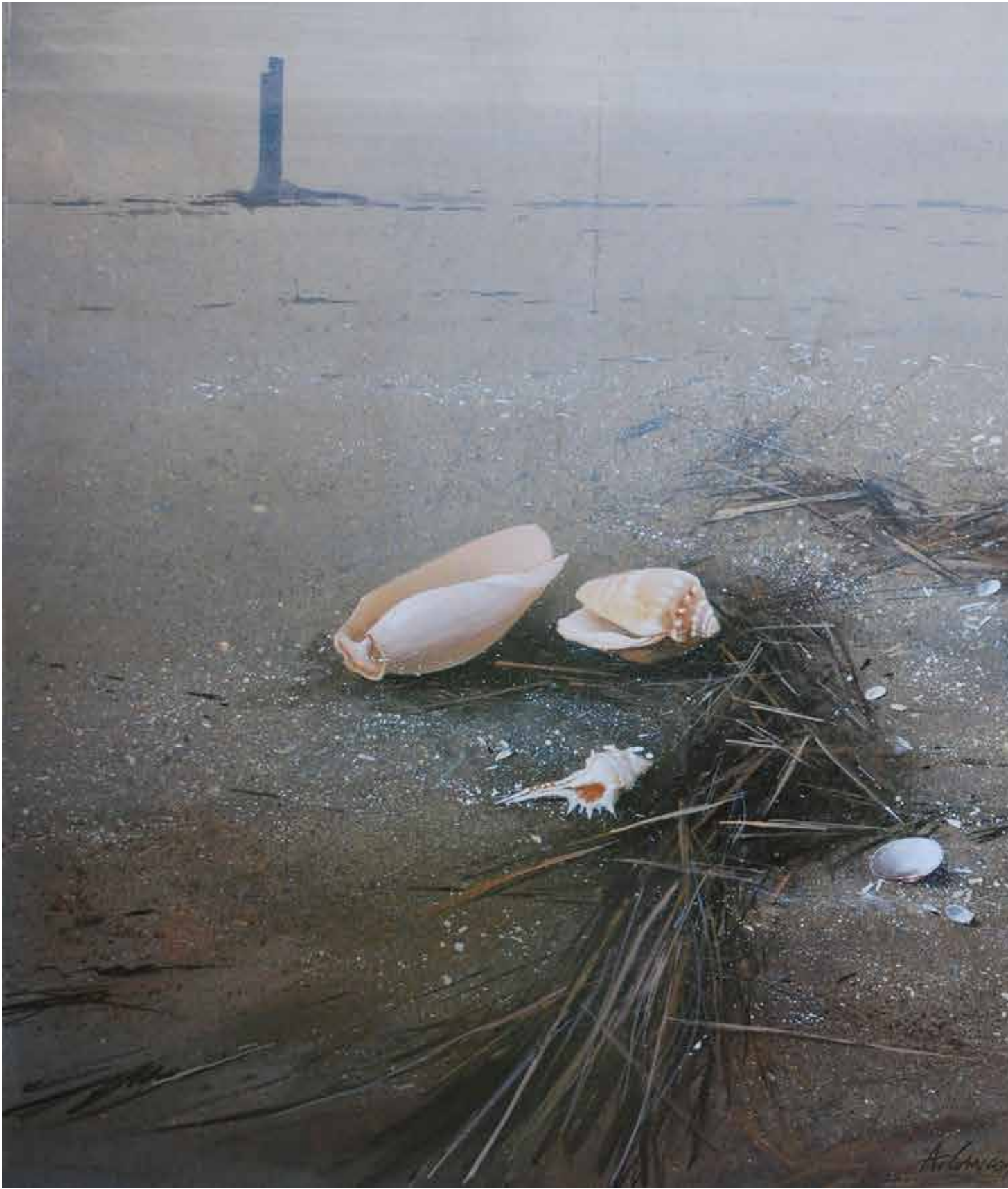
Spiaggia , olio su tavola cm 90x150, 2015