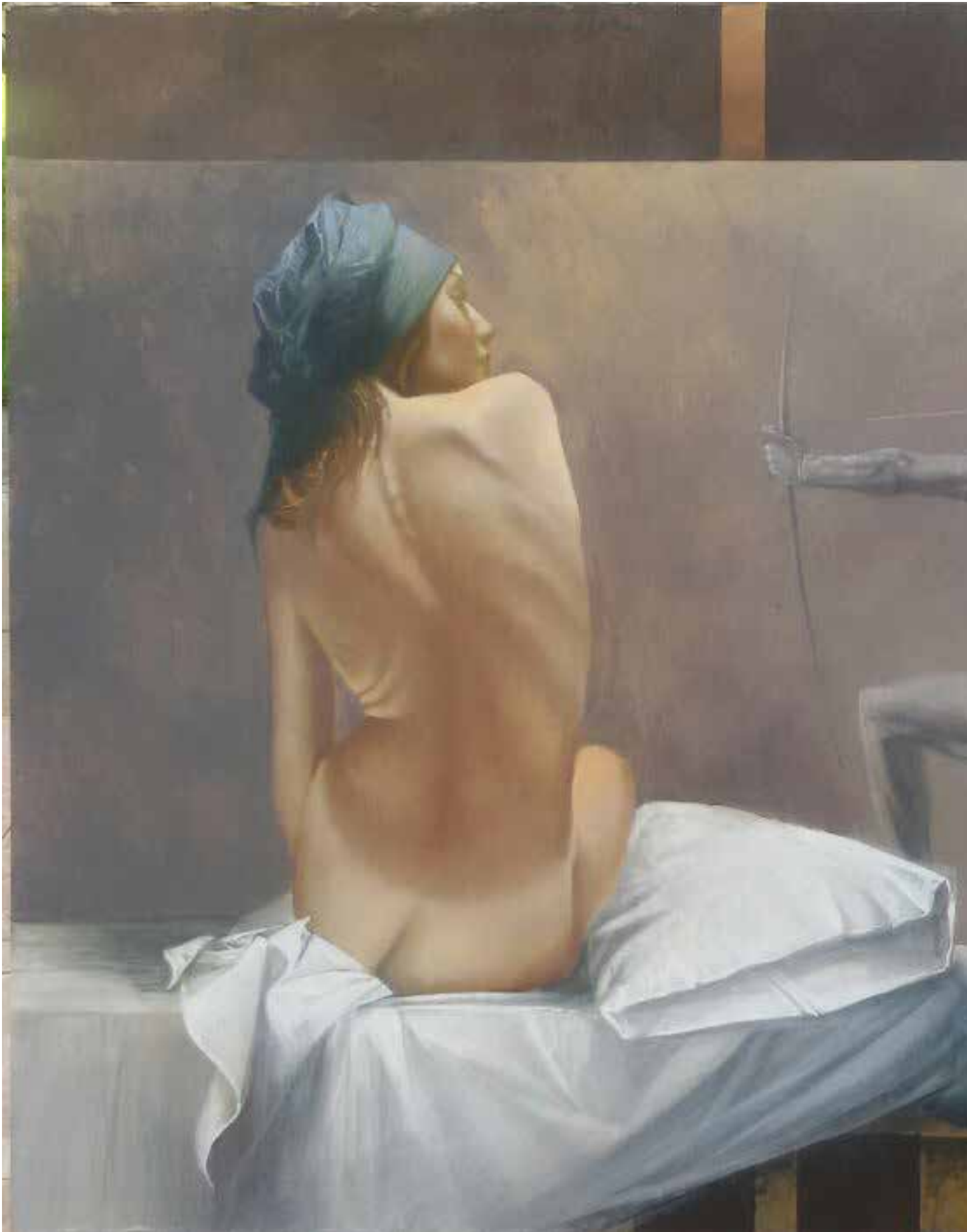
Sei Tu cacciatore , olio su cartone cm 60x80, 2018