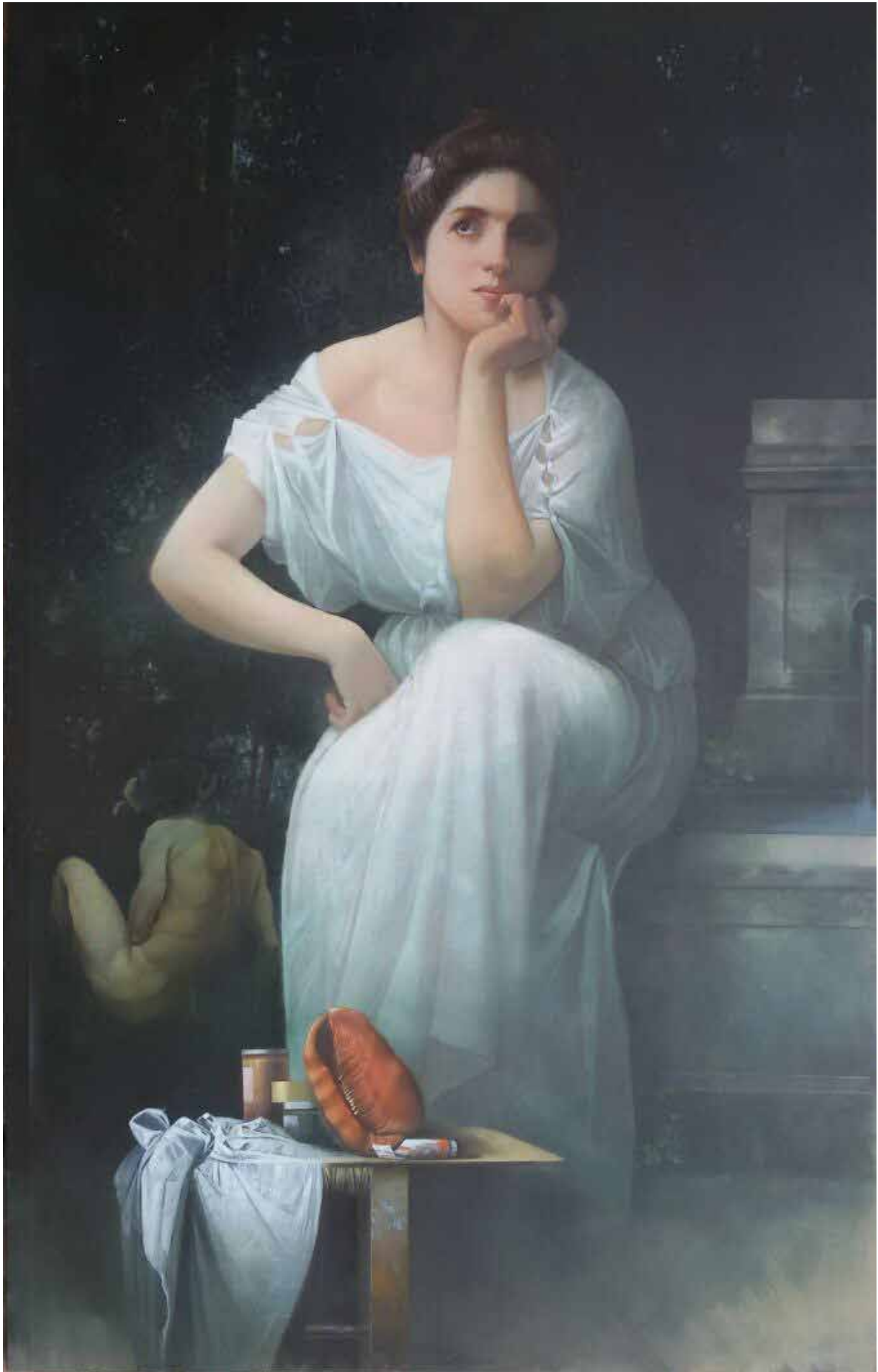
Io sono Divina , olio su tela cm 98x150, 2018