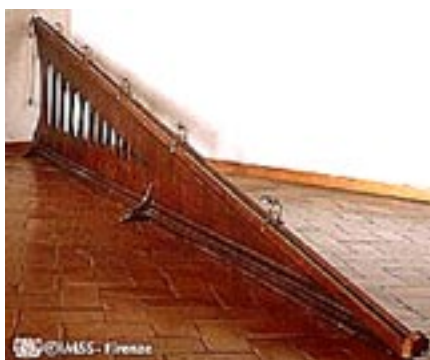
Figura 4. Copia della guida inclinata di Galileo presso il Museo di Storia della Scienza di Firenze.