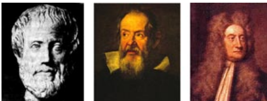
Figura 1. Aristotele, Galileo Galilei, Isaac Newton.

V'è un concetto che lega i tre grandi pensatori con un ideale filo rosso. Aristotele scrisse: «La Natura non produce nulla che non sia utile», Galileo: «E sempre gustai della semplicità e facilità della Natura, che non intraprende a fare quello che non può essere fatto, non opera con molte cose quello che può con poche», e Newton infine: «La Natura non fa nulla di inutile, giacché il più non serve, quando basta il meno : essa ama la semplicità e disdegna il fasto delle cose superflue». E così un altro concetto, che limiterò all'enuciazione fatta da Galileo: «Val più trovare il vero di picciol cosa che il disputar lungamente delle massime questioni senza conseguir verità nessuna». Vediamo in figura 1 i ritratti dei magnifici tre. Un posto di quarto magnifico spetterebbe naturalmente ad Einstein, che