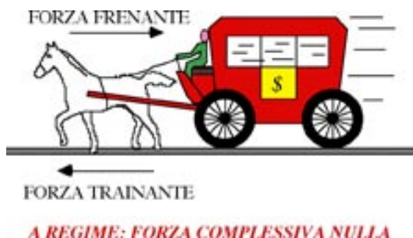
Figura 5. La velocità di crociera si ha allorché la forza trainante eguaglia quella resistente dovuta ai vari attriti.

Tutto ciò implica che la proporzionalità non sia tra forza e velocità, bensì tra forza e accelerazione. In assenza di forza risultante non può esservi accelerazione, per cui la velocità di crociera resta costante ( principio di inerzia ). Nel caso di una carrozza a cavalli, l'argomento che aumentando il numero dei cavalli la velocità aumenta è prontamente rimosso osservando che la velocità di regime della carrozza si ha quando la forza traente (cavalli) e quella resistente (attrito dell'aria o del suolo) si equilibrano. In altre parole, la carrozza a regime avanza senza accelerazione, quindi di moto inerziale.