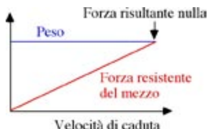
Figura 3. La velocità di caduta di un corpo diviene costante quando la forza resistente dovuta all'attrito del mezzo arriva a bilanciare la forza-peso.

un paracadute). Se il mezzo è assai denso, olio ad esempio, tale condizione terminale viene raggiunta prestissimo e la velocità di caduta appare quasi subito costante e proporzionale appunto al peso, come volevano gli aristotelici. In caso contrario, la fase di accelerazione è importante e va esaminata con la necessaria perizia.