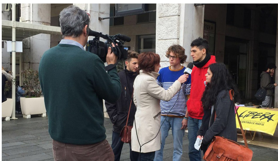
Partecipazione e intervento alla "Giornata della Memoria e dell'Impegno in ricordo delle vittime innocenti delle mafie" nelle città di Pistoia, Livorno e Firenze