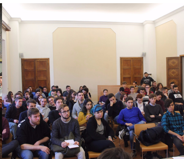
Consiglio Provinciale degli Studenti di Pistoia Secondo Incontro

Sala Nardi Palazzo della Provincia di Pistoia