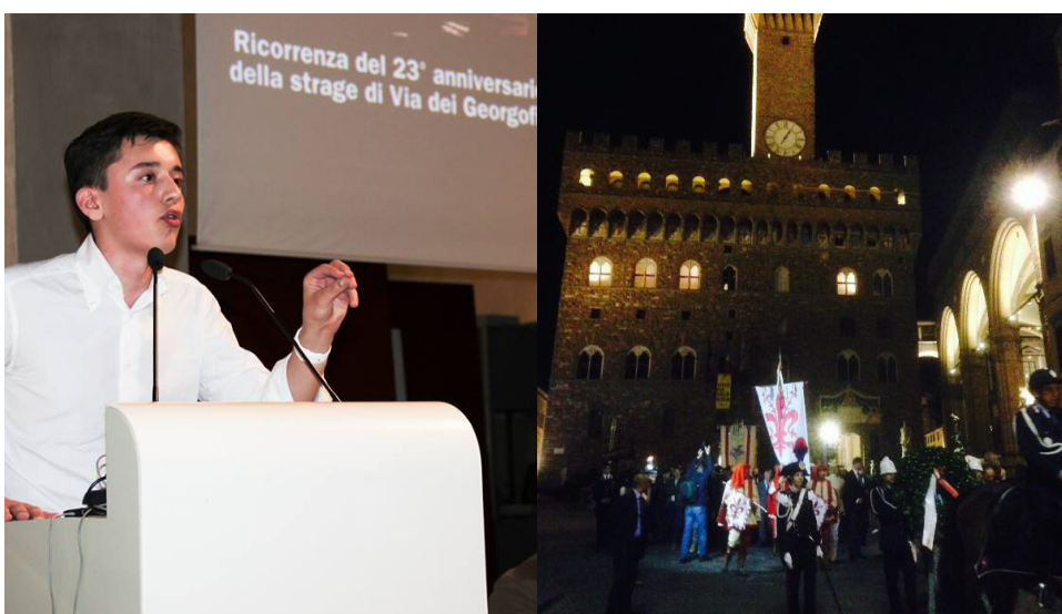
Manifestazioni per la ricorrenza del 23° anniversario della strage di Via dei Georgofili presso Auditorium di Sant'Apollonia e Arengario di Palazzo Vecchio con il Presidente del Senato della Repubblica