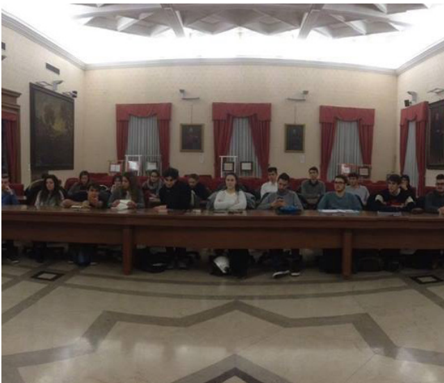
Consiglio Provinciale degli Studenti di Livorno

Sala Consiliare Palazzo della Provincia di Livorno