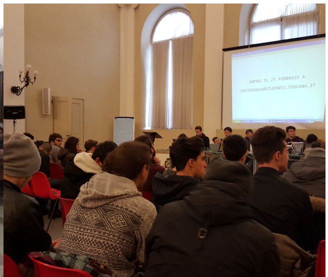
Consiglio Provinciale degli Studenti di Lucca

Sala Mario Tobino Palazzo della Provincia di Lucca