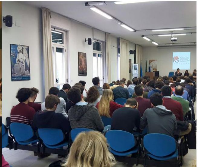
Consiglio Provinciale degli Studenti di Arezzo