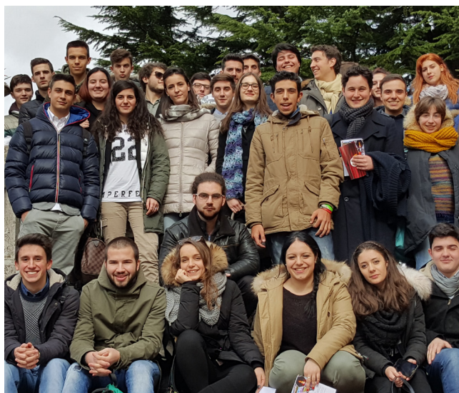
Consiglio Provinciale degli Studenti di Massa Carrara