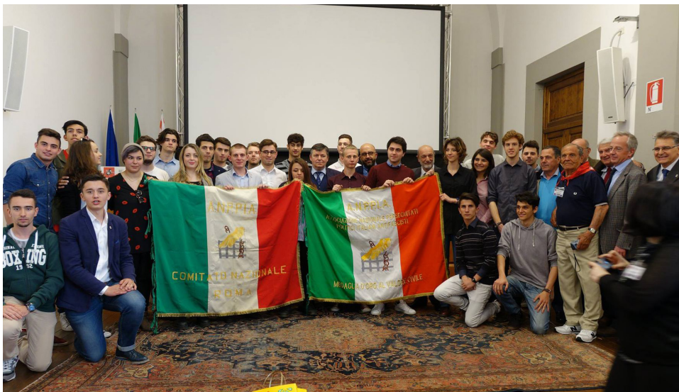
Intervento convegno ANPPIA Nazionale "Per un'Europa unita: i valori di Ventotene come antidoto ai movimenti neofascisti e nazionalisti"