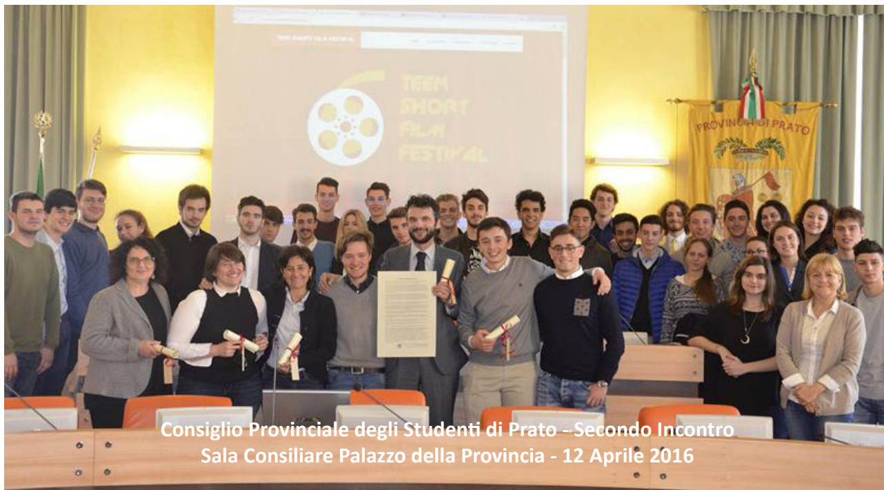
Consiglio Provinciale degli Studenti di Prato - Secondo Incontro Sala Consiliare Palazzo della Provincia - 12 Aprile 2016