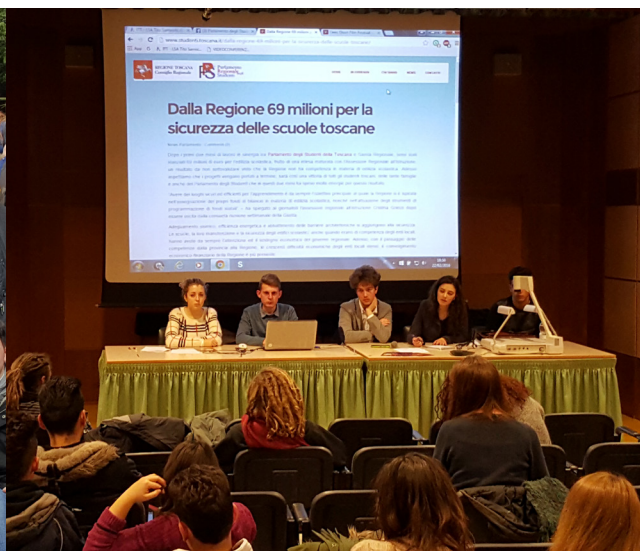
Consiglio Provinciale degli Studenti di Siena

Aula Magna ITTS "Tito Sarrocchi" di Siena