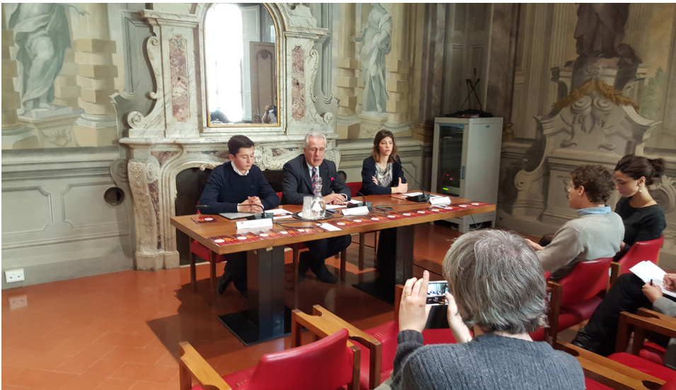
Conferenza stampa di presentazione della Terza edizione del Teen Short Film Festival in Consiglio Regionale della Toscana