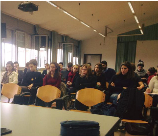
Consiglio Provinciale degli Studenti di Pisa

Aula Magna LS "XVV Aprile di Pontedera (PI)