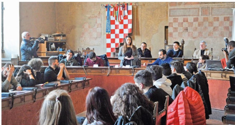
I rappresentanti degli studenti nella sala consiliare

L'80 per cento dei laboratori sono inagibili e non accessibili al Fedi-Fermi . Gli studenti si ritrovano a lavorare con gli strumenti di laboratorio all'interno delle proprie classi, dato che solo due laboratori sono disponibili. Segnalata inoltre la presenza di topi, che ha portato a interventi di vario genere per un costo di 3.000 euro, prelevati dal piano dell'offerta formativa per acquistare trap-