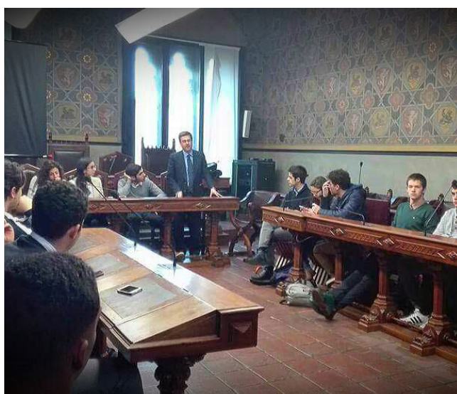
Consiglio Provinciale degli Studenti di Grosseto

Sala Consiliare Palazzo della Provincia di Grosseto