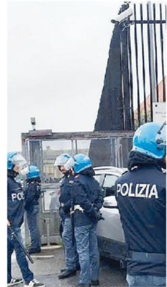
La polizia davanti alla Dogaia