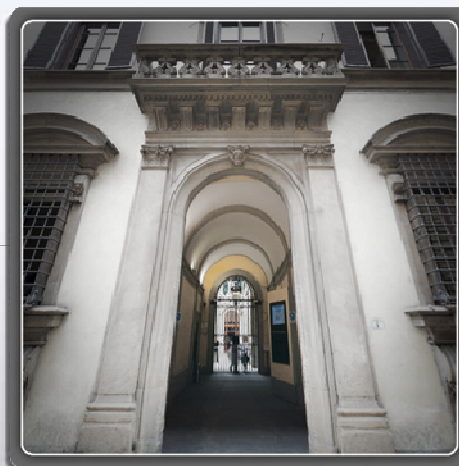
— Visita virtuale