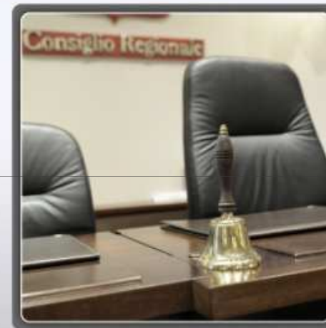
— Consiglio Regionale