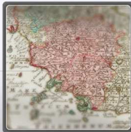
— Regione Toscana