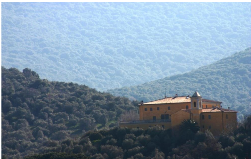
Foto – Villa Fattoria Granducale – Tenuta di Alberese – struttura agrituristica

Di seguito una tabella sintetica che riporta altri elementi che caratterizzano l'ospitalità della Tenuta di Alberese.