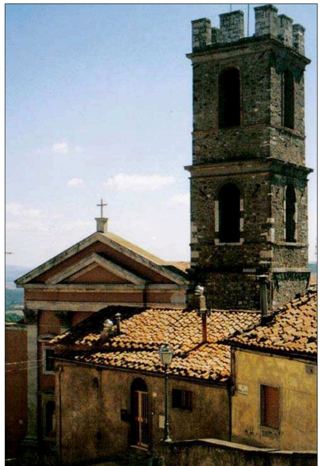
Uno scorcio di Manciano